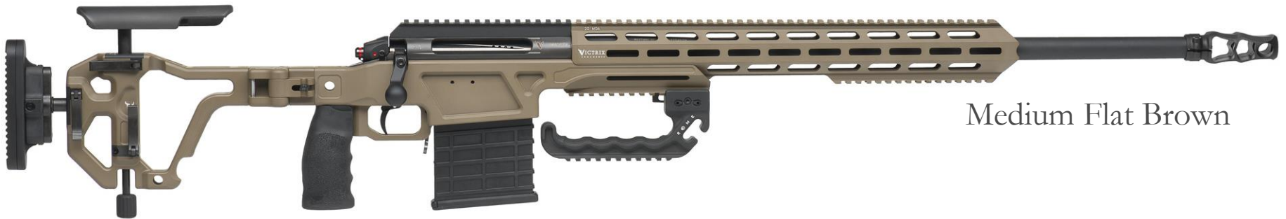
Medium Flat Brown