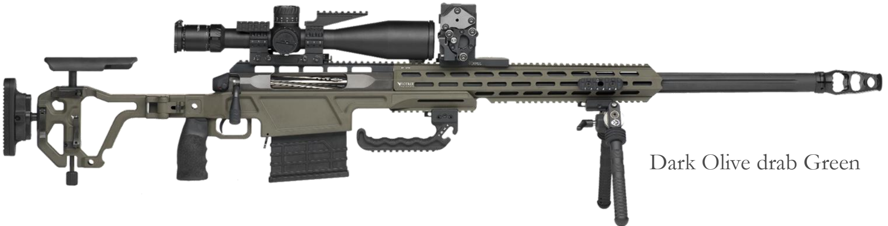
Dark Olive drab Green