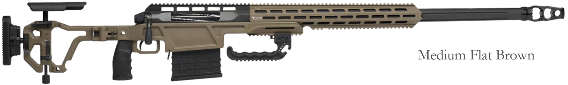
Medium Flat Brown