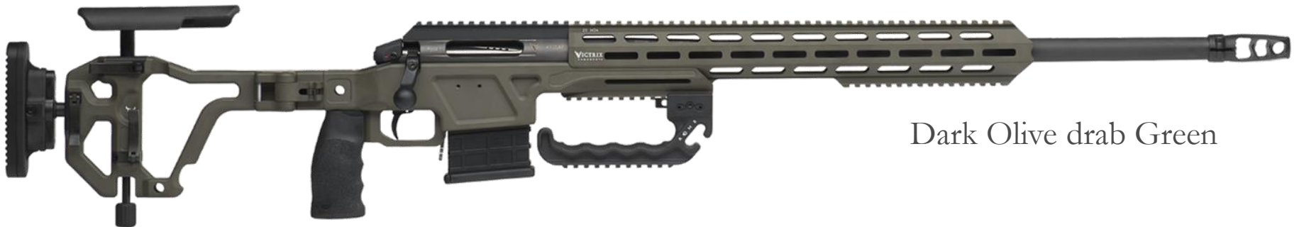
Dark Olive drab Green