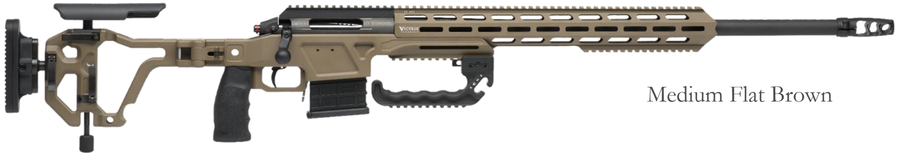
Medium Flat Brown