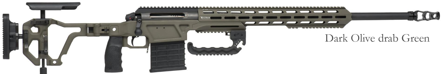
Dark Olive drab Green