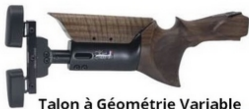
Talon à Géométrie Variable