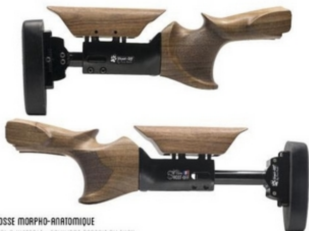
CRASSE MORPHO-ANATOMIQUE 100% AJUSTABLE - EQUILIBRE PARFAIT DU FUSIL