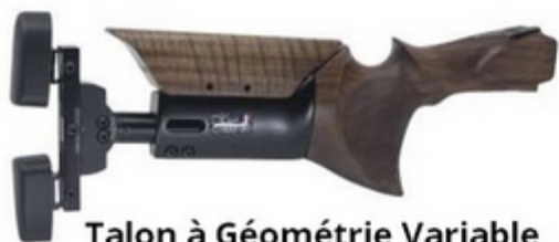
Talon à Géométrie Variable