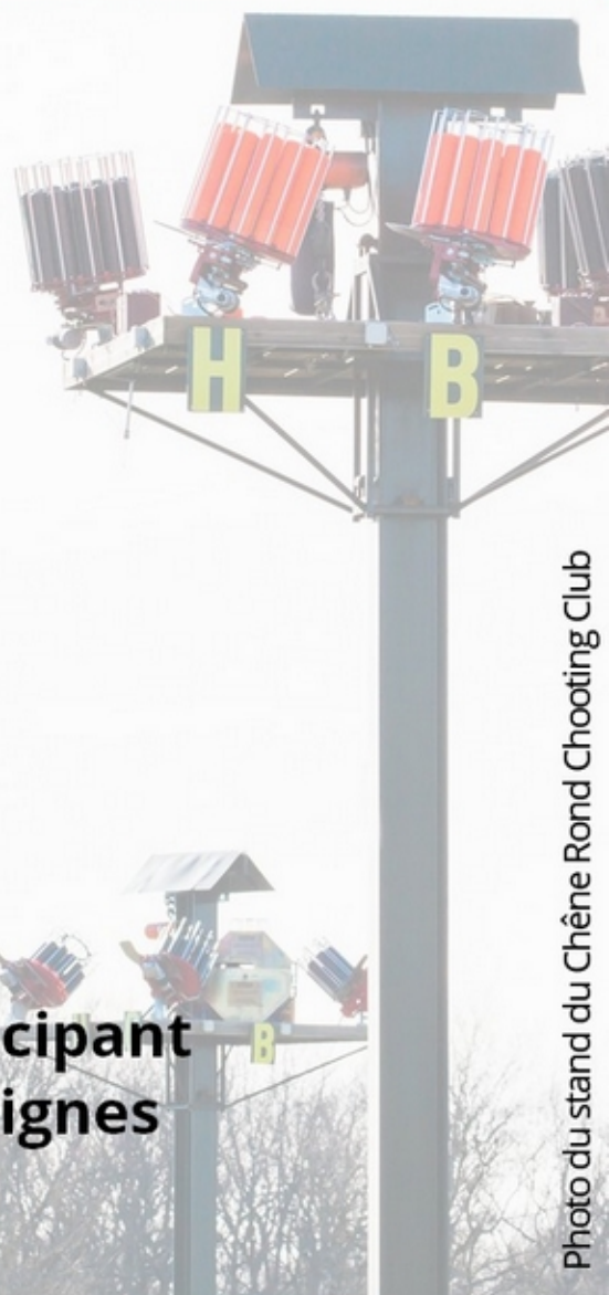
Photo du stand du Chêne Rond Shooting Club

- Selon les données du site internet fédéral organisateur